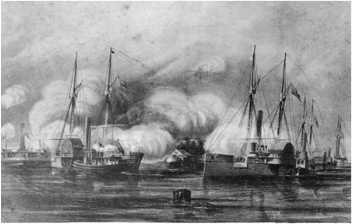
Il USS Tacony, poi distrutto da Read

dormiva saporitamente; gli uomini di Read ebbero facilmente il sopravvento sulle sentinelle, si impossessarono della barca e si diressero in alto mare.